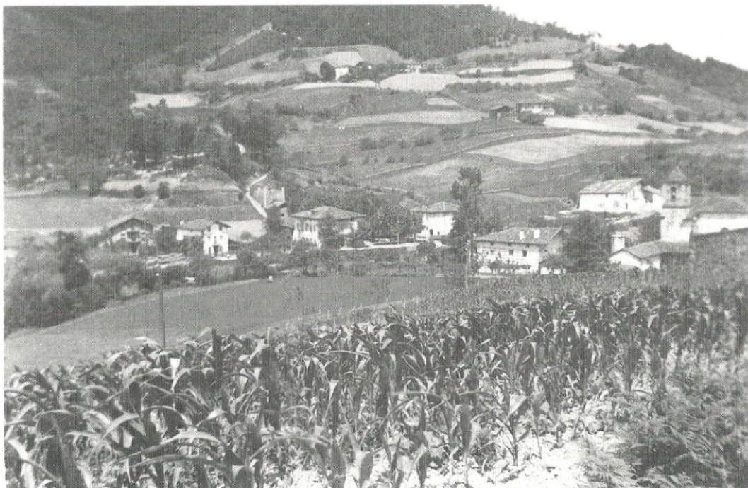
Arantzazu, 1948 aldera

Liburu honek Bizkaiko Foru Aldundiko Kultura Sailaren dirulaguntzari esker ikusi dau argia.